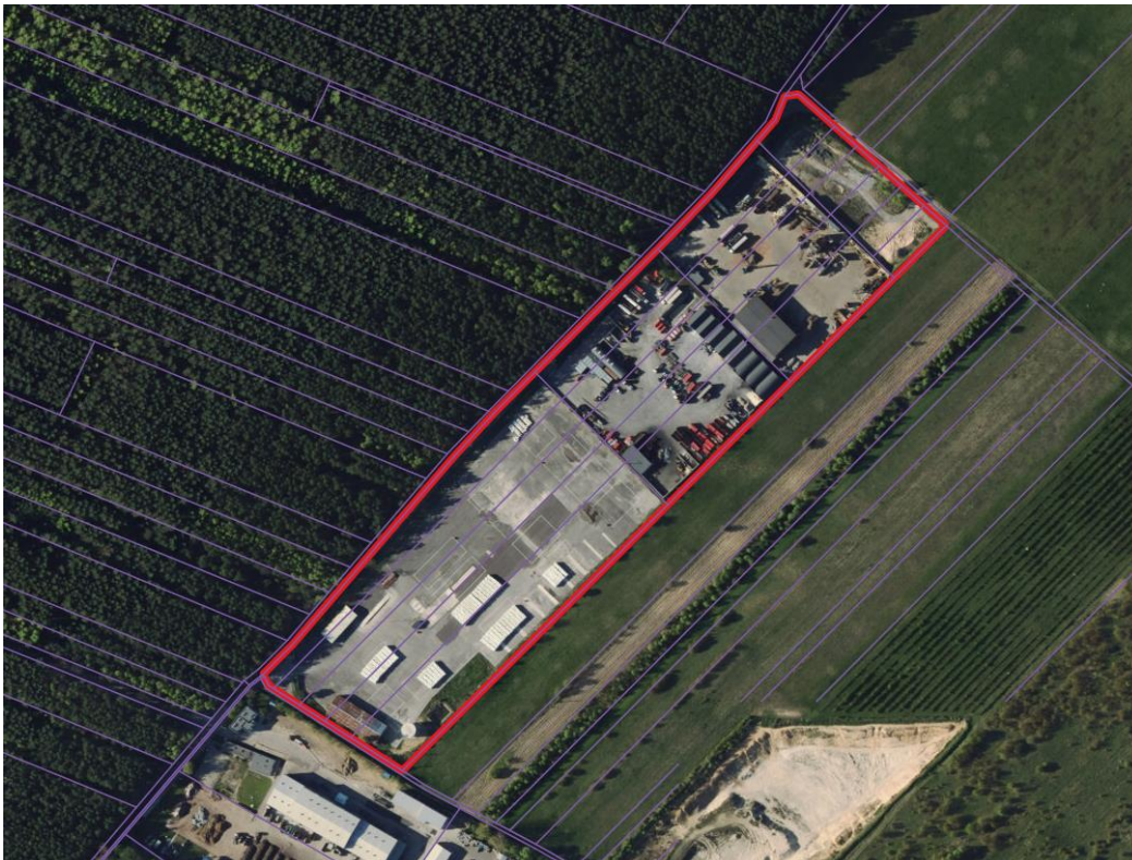
Rys. 2. Istniejące użytkowanie terenu

Obszar objęty opracowaniem jest obecnie w pełni zagospodarowany na funkcje wynikające z ustaleń obowiązującego planu miejscowego. Dominuje użytkowanie związane z prowadzeniem działalności polegającej na składowaniu i magazynowaniu oraz towarzyszące funkcje transportowe realizowane poza budynkami (place postojowe, manewrowe itp.). Na uwagę zwraca istniejące utwardzenie terenu oraz pozostająca w granicach minimalnego wskaźnika powierzchnia biologicznie czynna. Na zabudowę składają się niewielkie budynki oraz wiaty. Uzupełnieniem zagospodarowania są elementy infrastruktury technicznej.